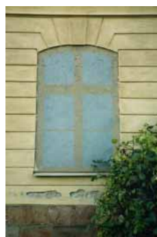
Sturehofs slott blindfönster